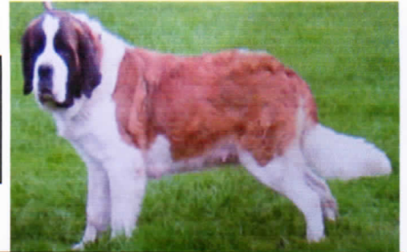
Photographie du St Bernard

radiographie par Dr Mimouni 32600 L'Isle Jourdain